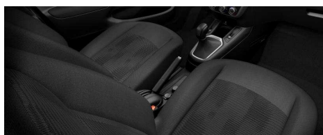
8HFR - Crna unutrašnjost od tkanine ACTIVE

• = Unutrašnjost u seriji o = Unutrašnjost u opciji;