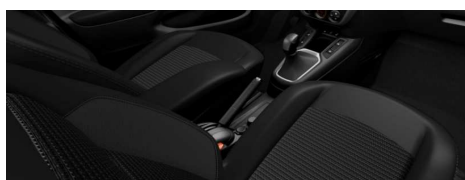
04FX - unutrašnjost od kože i tkanine