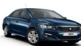
JGM0 - PLAVA NUIT