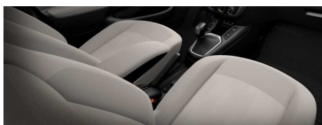
08FZ - Svijetla unutrašnjost od tkanine ALLURE