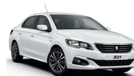
WPP0 - BIJELA BANQUISE