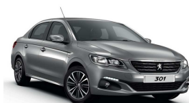
VLMO - SIVA PLATINUM