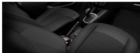
1Vfy - Crna unutrašnjost od tkanine ALLURE