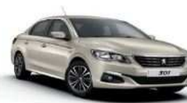
EUM0 - BEŽ SABLE