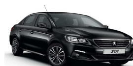
XYP0 - CRNA ONYX