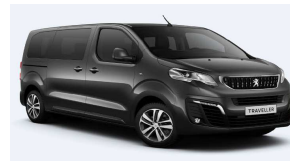
VLMO - Siva Platinum