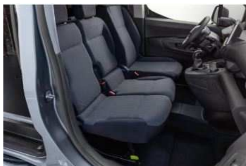
OAFY – Tkanina tamna unutrašnjost

• = Serijska unutrašnjost o = Opcijska unutrašnjost / = nije dostupno