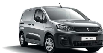
F4M0 - SIVA ARTENSE