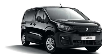
XYP0 - CRNA ONYX