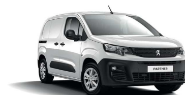
WPP0 - BIJELA BANQUISE