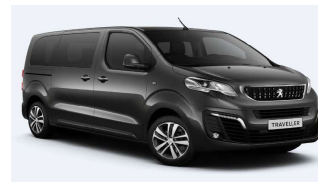
VLM0 - Siva Platinum