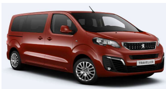
V7M0 - Narandžasta Tourmaline