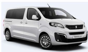
WPP0 – Bijela Banquise