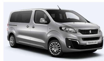
F4M0 - Siva Artense