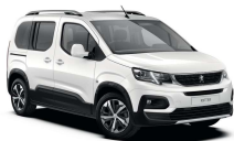
WPP0 - BIJELA BANQUISE