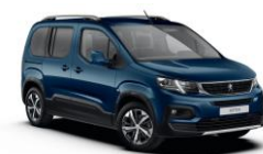
JGM0 - PLAVA NUIT