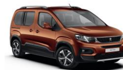
LGMO - SMEĐA CUPRITE