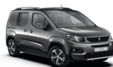
VLMO - SIVA PLATINIUM