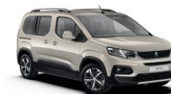
EUM0 - BEŽ SABLE