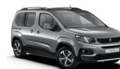
F4M0 - SIVA ARTENSE