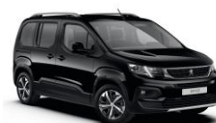
XP00 - CRNA ONYX