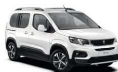
WPP0 - BIJELA BANQUISE