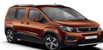
LGM0 - SMEĐA CUPRITE