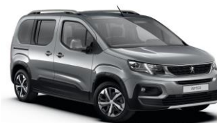
F4M0 - SIVA ARTENSE