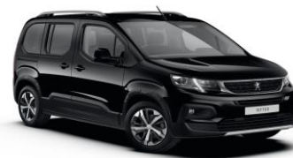
9VM0 - CRNA PERLA NERA