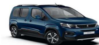
JGM0 - PLAVA NUIT