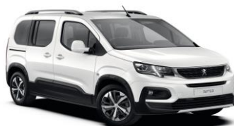
WPP0 - BIJELA BANQUISE