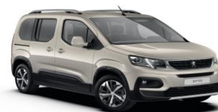
EUM0 - BEŽ SABLE