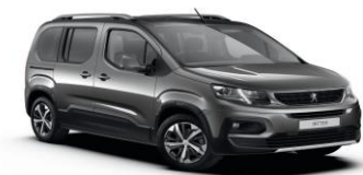
VLMO - SIVA PLATINIUM