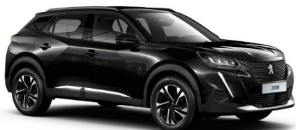
XYP0 - CRNA ONYX