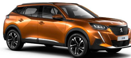
2SM0 - NARANČASTA FUSION