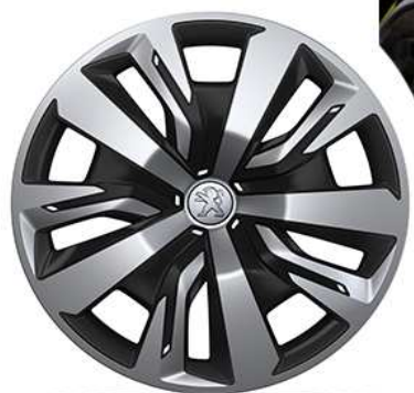
Activ 16" "NOLITA"