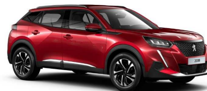
VHM5 - CRVENA ELIXIR