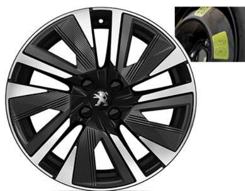
Allure/ Gt line 18" Aluminijski naplaci "BUND" uključuje rezervni kotač 16"