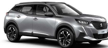
F4M0 - SIVA ARTENSE