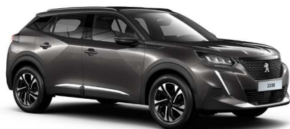
VLM0 - SIVA PLATIINIUM