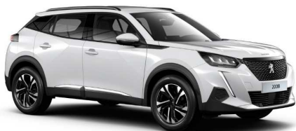
WPP0 - BIJELA BANQUISE