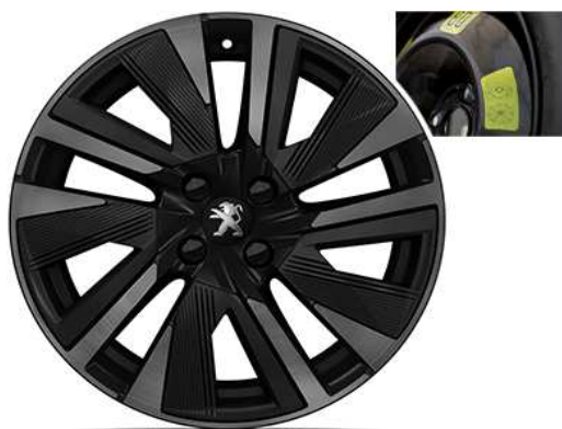
Gt line / GT18" Aluminijski naplaci "EVISSA" uključuje rezervni kotač 16"