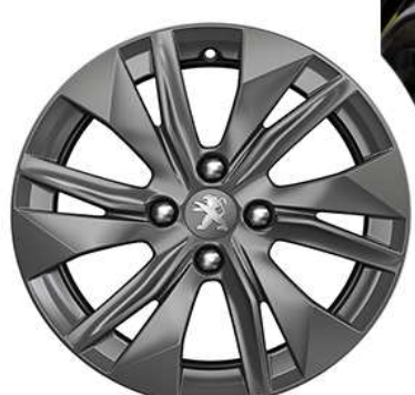
Activ 16" Aluminijski naplaci "ELBORN" uključuje rezervni kotač 16"