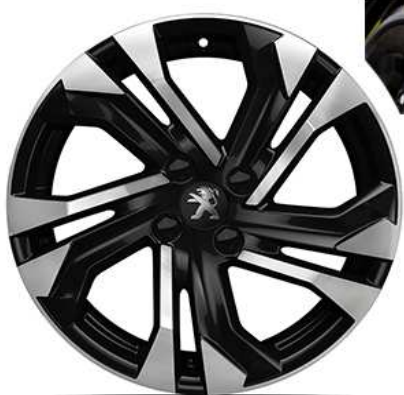
Allure/ Gt line 17" "SALAMANCA"