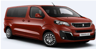
V7M0 - Narandžasta Tourmaline