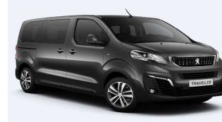
VLM0 - Siva Platinum