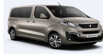
EUM0 - Siva Nautilus