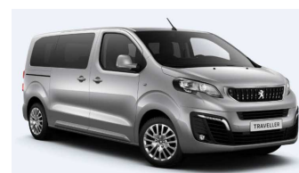
F4M0 - Siva Artense