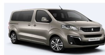
EUM0 - Siva Nautilus