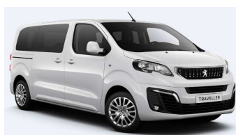
WPP0 - Bijela Banquise