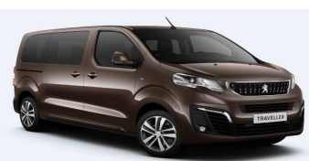
G6M0 - Smeđa Rich Oak