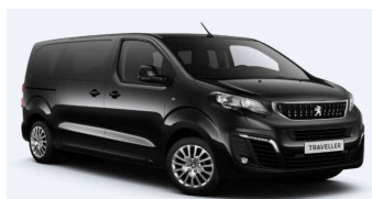
9VM0 - Crna Perla Nera