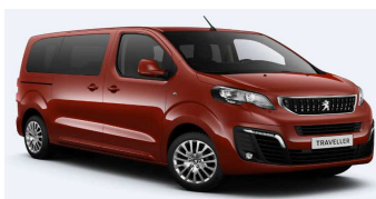
V7M0 - Narandžasta Tourmaline