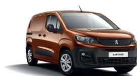
LGM0 - BAKRENA CUPRITE