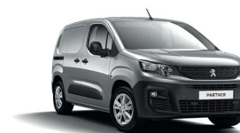
F4M0 - SIVA ARTENSE