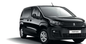
XYP0 - CRNA ONYX