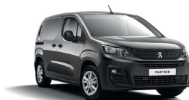
VLM0 - SIVA PLATINUM