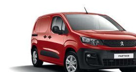
X9P0 - CRVENA ARDENT