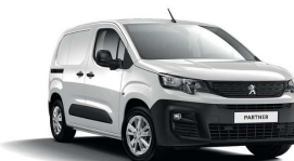
WPP0 - BIJELA BANQUISE