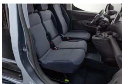
OAFY – Tkanina tamna unutrašnjost

• = Serijska unutrašnjost o = Opcijska unutrašnjost / = nije dostupno