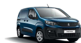
JGM0 - PLAVA NUIT